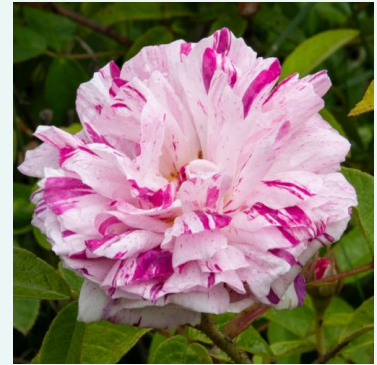
Rosa Village Maid

vaaleanpunainen - historiallinen - perpetual hybridi ruusu 90-150 cm hienovaraisen tuoksuinen ruusu - teearominen François Lacharme