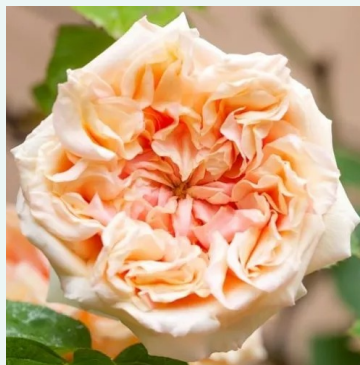
Rosa Gloire de Dijon

liila - historiallinen - bourbon ruusu 90-180 cm hienovaraisen tuoksuinen ruusu - hapan arominen Rudolf Geschwind