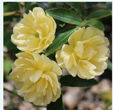
Rosa Banksiae lutea

valkoinen - historiallinen - rambler, köynnösrusu 600-1200 cm voimakkaan tuoksuinen ruusu - orvokinarominen William Kerr