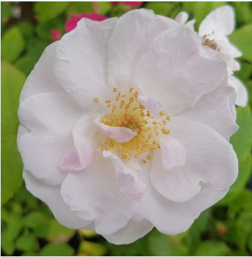
Rosa Venusta Pendula

valkoinen - historiallinen - rambler, köynnösrusu 300-600 cm hienovaraisen tuoksuinen ruusu - mausteinen arominen -