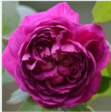
Rosa Reine des Violettes

vaaleanpunainen - historiallinen - bourbon ruusu 180-400 cm voimakkaan tuoksuinen ruusu - vanilja-arominen Mauget