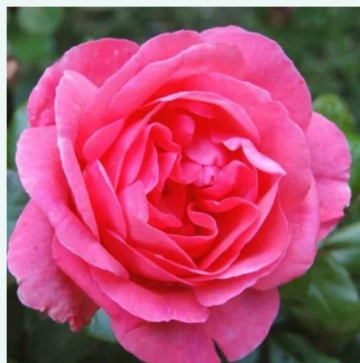
Rosa Frau Dr. Schricker

valkoinen - historiallinen - vanha puutarharuusu 120-150 cm keskivahvasti tuoksuva ruusu - sitruunan arominen Morlet