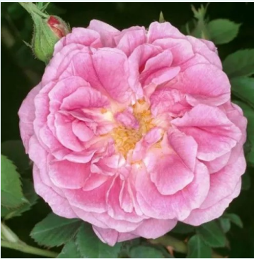
Rosa Queen of Bourbons

vaaleanpunainen - historiallinen - damaskonruusu 120-150 cm voimakkaan tuoksuinen ruusu - mansikan arominen -