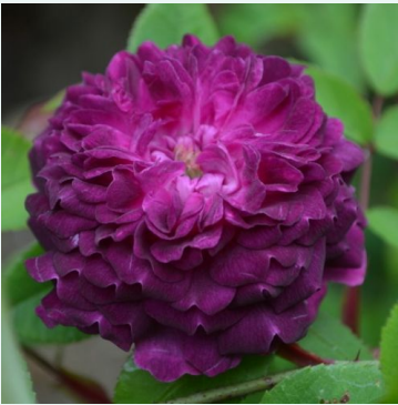
Rosa Général Stefánik

vaaleanpunainen - historiallinen - sammalruusu 120-180 cm voimakkaan tuoksuinen ruusu - damaskonruusun arominen M. Robert