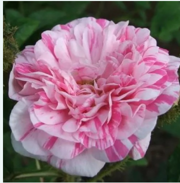
Rosa Madame Moreau

vaaleanpunainen - historiallinen - portland ruusu 90-120 cm voimakkaan tuoksuinen ruusu - omenan arominen Victor Verdier