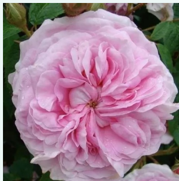
Rosa New Maiden Blush