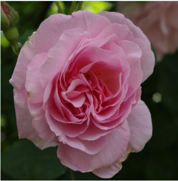
Rosa Fritz Nobis®