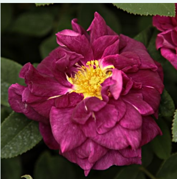
Rosa Tuscany Superb

liila - historiallinen - vanha puutarharuusu 200-300 cm hienovaraisen tuoksuinen ruusu - hapan arominen Rudolf Geschwind