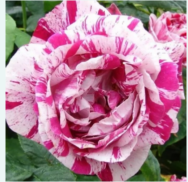
Rosa Ferdinand Pichard