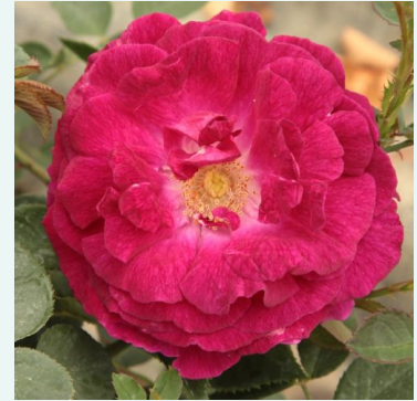
Rosa Trompeter von Säckingen