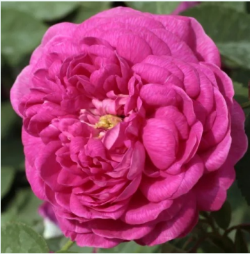
Rosa Rose de Resht

liila - historiallinen - portland ruusu 90-120 cm voimakkaan tuoksuinen ruusu - syreeninarominen