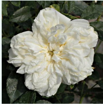
Rosa Albéric Barbier

vaaleanpunainen - historiallinen - gallica ruusu 100-150 cm voimakkaan tuoksuinen ruusu - damaskonruusun arominen Coquerel