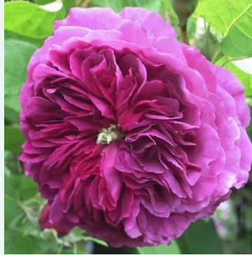
Rosa Erinnerung an Brod