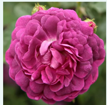
Rosa Cardinal de Richelieu

liila - historiallinen - sammalruusu 120-180 cm voimakkaan tuoksuinen ruusu - centifolian arominen Jean Laffay