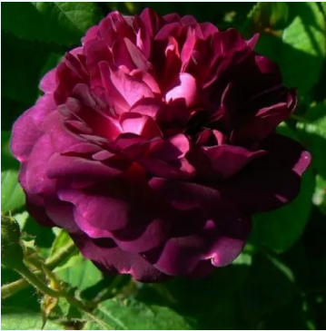
Rosa Ombrée Parfaite

liila - historiallinen - gallica ruusu 70-90 cm hienovaraisen tuoksuinen ruusu - hedelmäinen arominen Jean-Pierre Vibert