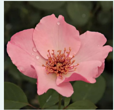
Rosa Dainty Bess

keltainen - historiallinen - noisette ruusu 180-400 cm voimakkaan tuoksuinen ruusu - greipin arominen Francis Dubreuil