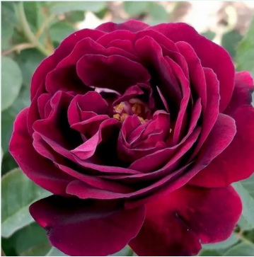
Rosa Souvenir du Docteur Jamain

vaaleanpunainen - historiallinen - bourbon ruusu 60-120 cm voimakkaan tuoksuinen ruusu - aniksinen arominen Jean Beluze