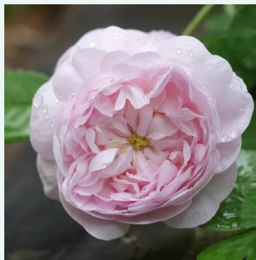
Rosa Duchesse De Montebello