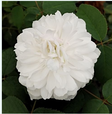
Rosa White Jacques Cartier

liila - historiallinen - gallica ruusu 150-220 cm voimakkaan tuoksuinen ruusu - sitruunan arominen -