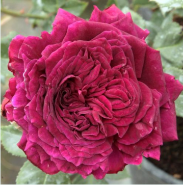
Rosa Empereur du Maroc