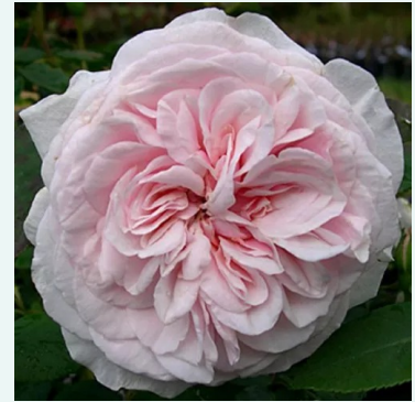
Rosa Souvenir de la Malmaison

vaaleanpunainen - historiallinen - centifolia ruusu 160-180 cm voimakkaan tuoksuinen ruusu - persikan arominen