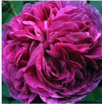
Rosa Belle de Crécy

punainen - valkoinen - historiallinen - perpetual hybridi ruusu 100-150 cm voimakkaan tuoksuinen ruusu - mangoarominen Reverchon