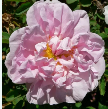
Rosa Stanwell Perpetual