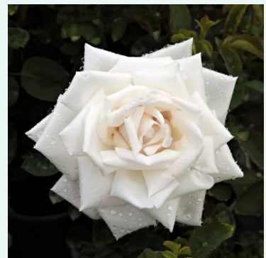
Rosa Frau Karl Druschki

vaaleanpunainen - historiallinen - kiinanruusu 80-120 cm voimakkaan tuoksuinen ruusu - kielon arominen Johannes Felberg-Leclerc