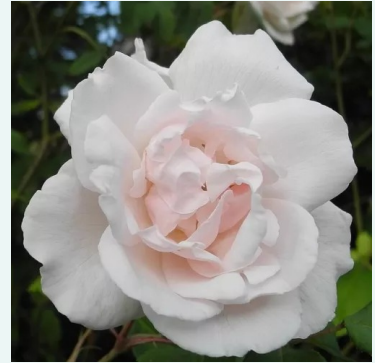
Rosa Madame Alfred Carrière

valkoinen - historiallinen - rambler, köynnösrusu 550-610 cm voimakkaan tuoksuinen ruusu - syreeninarominen Aksel Olsen