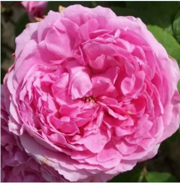
Rosa Madame Knorr

vaaleanpunainen - historiallinen - portland ruusu 90-120 cm voimakkaan tuoksuinen ruusu - omenan arominen Victor Verdier