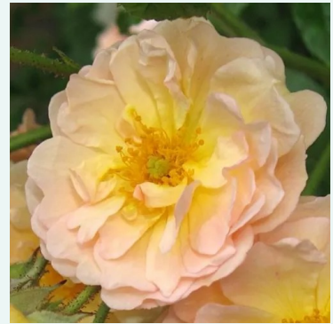
Rosa Ghislaine de Féligonde

vaaleanpunainen - valkoinen - historiallinen - vanha puutarharuusu 400-500 cm hienovaraisen tuoksuinen ruusu - makea arominen Rudolf Geschwind