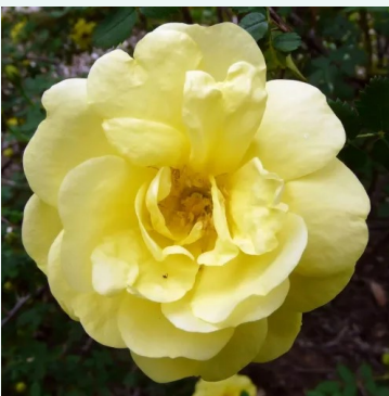
Rosa Rosa Harisonii

punainen - valkoinen - historiallinen - perpetual hybridi ruusu 90-150 cm voimakkaan tuoksuinen ruusu - hedelmäinen arominen Marie-Louise (aka Widow,Vve) Schwartz