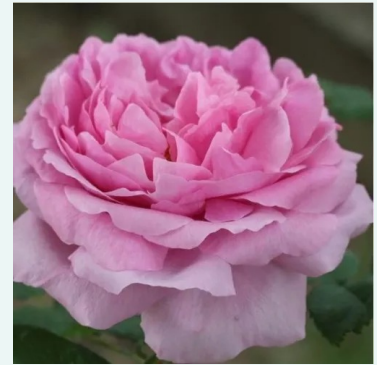
Rosa Comte de Chambord

liila - historiallinen - gallica ruusu 100-150 cm hienovaraisen tuoksuinen ruusu - hapan arominen