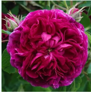
Rosa Charles de Mills

vaaleanpunainen - historiallinen - damaskonruusu 90-185 cm voimakkaan tuoksuinen ruusu - makea arominen