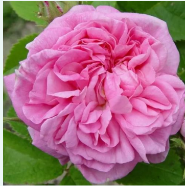
Rosa La Ville de Bruxelles

vaaleanpunainen - historiallinen - alba ruusu 120-180 cm voimakkaan tuoksuinen ruusu - damaskonruusun arominen James Booth