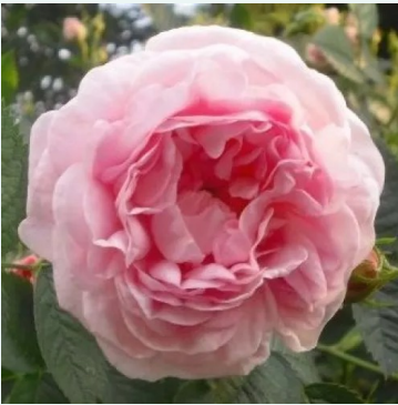
Rosa Maiden's Blush

valkoinen - historiallinen - alba ruusu 150-360 cm voimakkaan tuoksuinen ruusu - omenan arominen Plantier