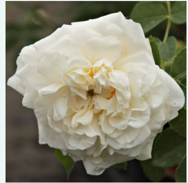
Rosa Madame Plantier

punainen - valkoinen - historiallinen - sammalruusu 100-120 cm voimakkaan tuoksuinen ruusu - damaskonruusun arominen Robert and Moreau