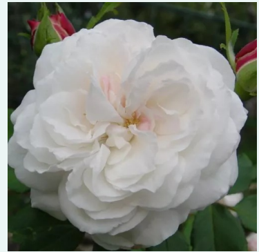
Rosa Boule de Neige

valkoinen - historiallinen - damaskonruusu 100-160 cm voimakkaan tuoksuinen ruusu - mangoarominen M. Robert