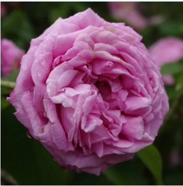
Rosa Coupe d'Hébé

vaaleanpunainen - historiallinen - portland ruusu 90-150 cm voimakkaan tuoksuinen ruusu - sitruunan arominen Robert and Moreau