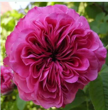
Rosa Duc de Cambridge

vaaleanpunainen - historiallinen - tee ruusu 60-130 cm hienovaraisen tuoksuinen ruusu - teearominen Wm. E. B. Archer & Daughter