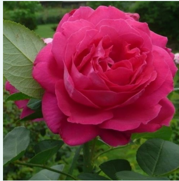
Rosa Victor Verdier

valkoinen - historiallinen - rambler, köynnösrusu 300-600 cm hienovaraisen tuoksuinen ruusu - mausteinen arominen -