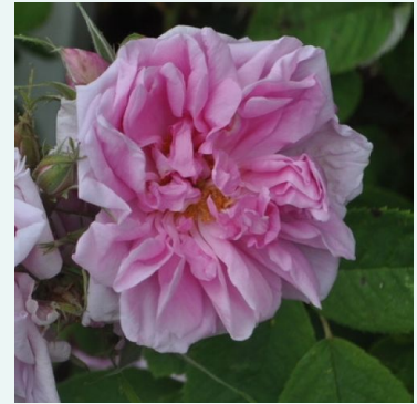
Rosa Quatre Saisons®

vaaleanpunainen - historiallinen - gallica ruusu 120-150 cm hienovaraisen tuoksuinen ruusu - mangoarominen Mme. Hébert