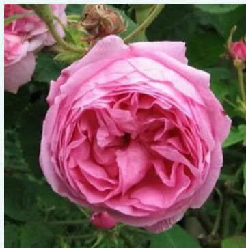
Rosa Typ Kassel

liila - historiallinen - gallica ruusu 100-150 cm hienovaraisen tuoksuinen ruusu - centifolian arominen Thomas Rivers & Son Ltd.