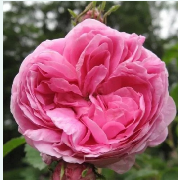
Rosa Rose des Peintres

liila - historiallinen - portland ruusu 90-120 cm voimakkaan tuoksuinen ruusu - syreeninarominen