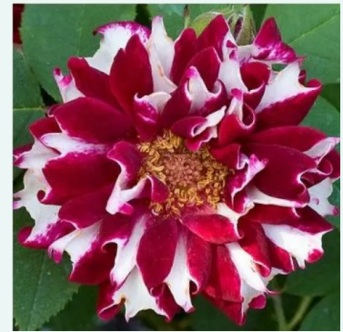
Rosa Roger Lambelin

liila - historiallinen - perpetual hybridi ruusu 120-240 cm voimakkaan tuoksuinen ruusu - mansikan arominen Mille-Mallet