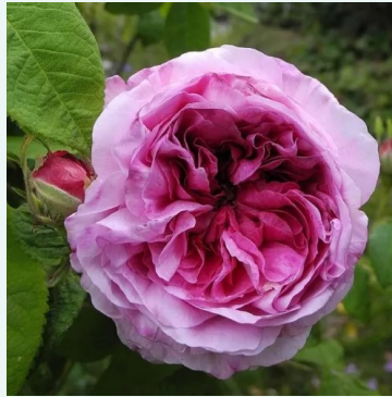
Rosa Président de Sèze

liila - historiallinen - gallica ruusu 70-90 cm hienovaraisen tuoksuinen ruusu - hedelmäinen arominen Jean-Pierre Vibert