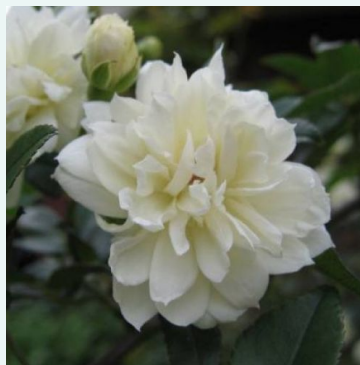
Rosa Banksiae alba

vaaleanpunainen - historiallinen - vanha puutarharuusu 300-400 cm hienovaraisen tuoksuinen ruusu - hedelmäinen arominen Rudolf Geschwind