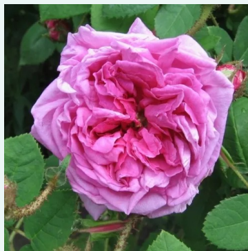
Rosa Julie de Mersan