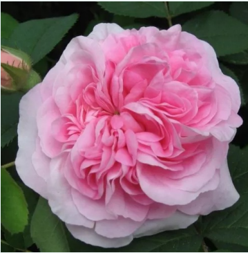
Rosa Königin von Dänemark

vaaleanpunainen - historiallinen - alba ruusu 120-180 cm voimakkaan tuoksuinen ruusu - damaskonruusun arominen James Booth