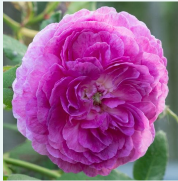
Rosa Geschwinds Orden

liila - historiallinen - perpetual hybridi ruusu 120-150 cm voimakkaan tuoksuinen ruusu - kielon arominen Jan Böhm