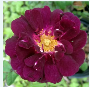
Rosa Nuits de Young

vaaleanpunainen - historiallinen - alba ruusu 120-180 cm voimakkaan tuoksuinen ruusu - persikan arominen James Booth