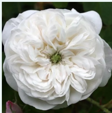
Rosa Madame Hardy

vaaleanpunainen - historiallinen - portland ruusu 150-180 cm voimakkaan tuoksuinen ruusu - persikan arominen Daniel Boll