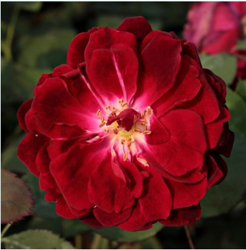
Rosa Gruss an Teplitz

punainen - historiallinen - kiinanruusu 150-200 cm voimakkaan tuoksuinen ruusu - orvokinarominen Rudolf Geschwind