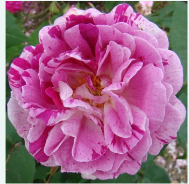
Rosa Honorine de Brabant

liila - historiallinen - vanha puutarharuusu 280-320 cm voimakkaan tuoksuinen ruusu - neilikkausteinen arominen Rudolf Geschwind