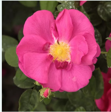
Rosa Gallica 'Officinalis'

vaaleanpunainen - historiallinen - vanha puutarharuusu 150-220 cm hienovaraisen tuoksuinen ruusu - mansikan arominen Wilhelm J.H. Kordes II.