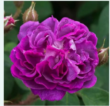
Rosa William Lobb

valkoinen - historiallinen - perpetual hybridi ruusu 90-120 cm voimakkaan tuoksuinen ruusu - omenan arominen Knud Pedersen