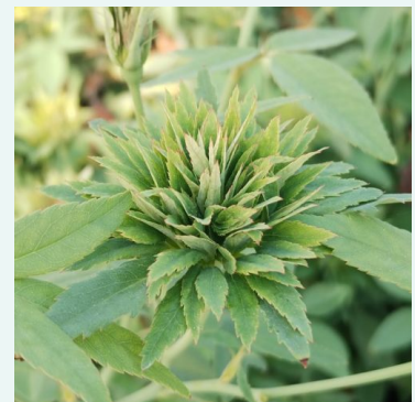
Rosa Rosa viridiflora

vaaleanpunainen - valkoinen - historiallinen - gallica ruusu 75-120 cm voimakkaan tuoksuinen ruusu - damaskonruusun arominen -