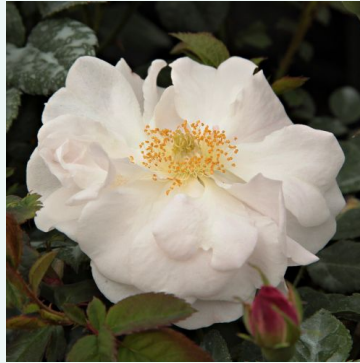
Rosa Félicité et Perpétue