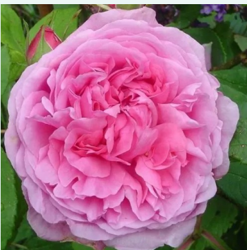
Rosa Madame Boll

vaaleanpunainen - historiallinen - noisette ruusu 250-700 cm keskivahvasti tuoksuva ruusu - makea arominen Joseph Schwartz