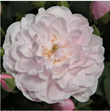
Rosa Blush Noisette

vaaleanpunainen - historiallinen - sempervirens ruusu 300-400 cm voimakkaan tuoksuinen ruusu - mangoarominen Antoine A. Jacques