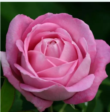
Rosa Mrs. John Laing