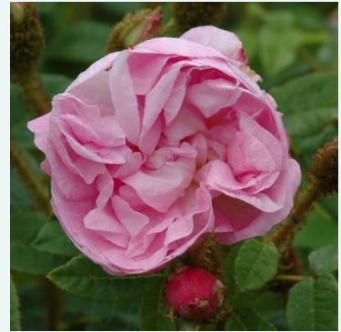
Rosa Général Kléber

vaaleanpunainen - historiallinen - gallica ruusu 90-150 cm voimakkaan tuoksuinen ruusu - omenan arominen -