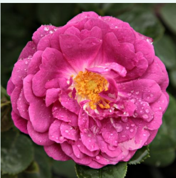
Rosa Gipsy Boy

keltainen - historiallinen - rambler, köynnösrusu 100-300 cm keskivahvasti tuoksuva ruusu - mausteinen arominen Eugène Turbat & Compagnie