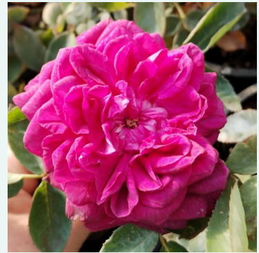
Rosa Arthur de Sansal®

valkoinen - historiallinen - alba ruusu 200-300 cm hienovaraisen tuoksuinen ruusu - teearominen Rudolf Geschwind