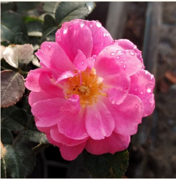
Rosa Magic Meillandecor

valkoinen - maanpeiteruusut 60-80 cm keskivahvasti tuoksuva ruusu - kanelin arominen Hans Jürgen Evers