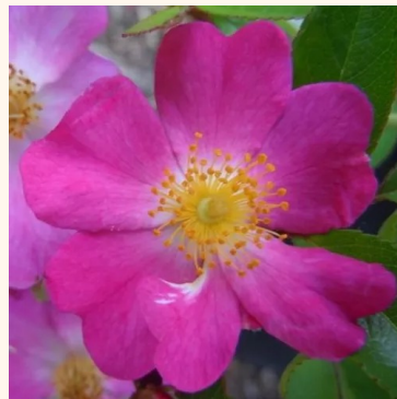
Rosa Fil des Saisons®

punainen - maanpeiteruus 40-80 cm hienovaraisen tuoksuinen ruusu - hapan arominen Ralph S. Moore