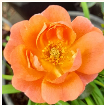
Rosa Tango Showground

keltainen - maanpeiteruus 30-50 cm hienovaraisen tuoksuinen ruusu - mansikan arominen Christian Bédard