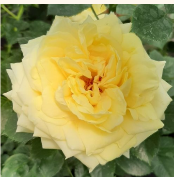
Rosa Nadia® Meillandecor®

valkoinen - maanpeiteruusut 60-70 cm hienovaraisen tuoksuinen ruusu - syreenin arominen W. Kordes & Sons