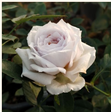
Rosa Pride of Tryon®

vaaleanpunainen - maanpeiteruus 20-30 cm ei tuoksua - - -