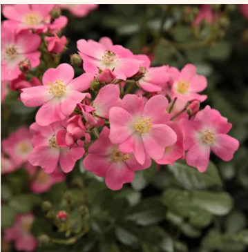
Rosa Budai Lina emléke

vaaleanpunainen - maanpeiteruus 20-30 cm hienovaraisen tuoksuinen ruusu - teearominen PhenoGeno Roses