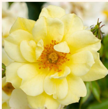
Rosa Coral Drift®

vaaleanpunainen - maanpeiteruus 10-50 cm ei tuoksua - - Győry Szilveszter