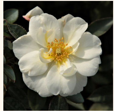
Rosa Kent Cover®

vaaleanpunainen - keltainen - maanpeiteruus 50-60 cm hienovaraisen tuoksuinen ruusu - neilikkausteinen arominen G. Peter Isink