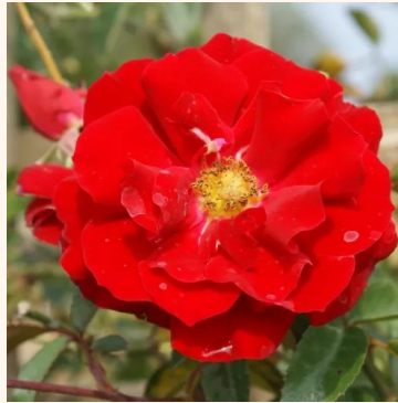
Rosa Red Ribbons

punainen - maanpeiteruus 30-40 cm ei tuoksua - - Alain Meillard