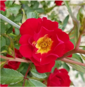
Rosa Red Drift®

punainen - maanpeiteruus 30-40 cm ei tuoksua - - Alain Meillard