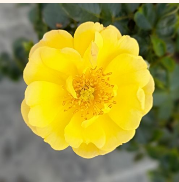
Rosa Sunshine Happy Trails®

vaaleanpunainen - maanpeiteruus 60-80 cm hienovaraisen tuoksuinen ruusu - makea arominen Reimer Kordes