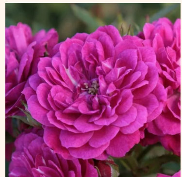
Rosa Purple Rain®

vaaleanpunainen - maanpeiteruus 60-80 cm ei tuoksua - - -