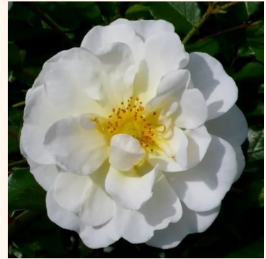
Rosa Magic Blanket

punainen - maanpeiteruusut 30-50 cm ei tuoksua - - Colin A. Pearce