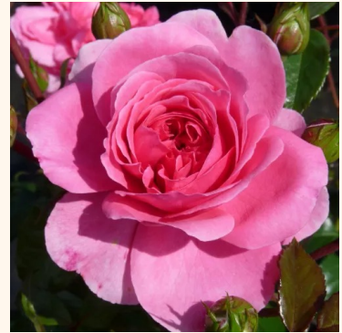
Rosa Palmengarten Frankfurt®

vaaleanpunainen - maanpeiteruus 30-150 cm hienovaraisen tuoksuinen ruusu - hapan arominen Dr. Tôru Onodera