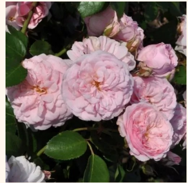
Rosa Blush™ Pixie®

oranssi - maanpeiteruus 40-60 cm hienovaraisen tuoksuinen ruusu - mansikan arominen Interplant