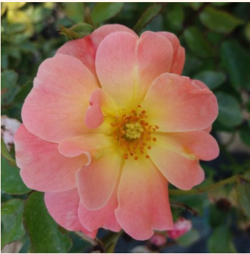
Rosa Peach Drift®

vaaleanpunainen - maanpeiteruus 60-90 cm ei tuoksua - - W. Kordes & Sons