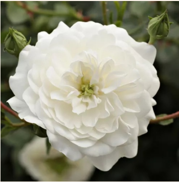
Rosa Alba Meilandina®

valkoinen - maanpeiteruus 30-50 cm ei tuoksua - - Marie-Louise (Louisette) Meiland