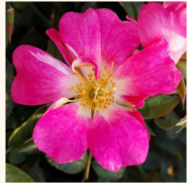
Rosa Pink Drift®

keltainen - maanpeiteruus 70-80 cm hienovaraisen tuoksuinen ruusu - hapan arominen Georges Delbard