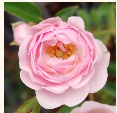
Rosa The Fairy

oranssi - maanpeiteruus 60-70 cm hienovaraisen tuoksuinen ruusu - aniksinen arominen Christopher H. Warner