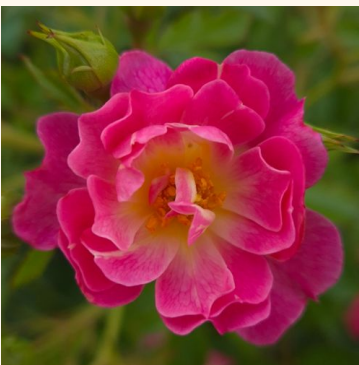
Rosa Pink Ricco Amorina

vaaleanpunainen - maanpeiteruus 40-50 cm ei tuoksua - - Jacques Mouchoffe