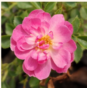
Rosa Easy Cover®

valkoinen - maanpeiteruus 60-90 cm ei tuoksua - - Wilhelm Kordes III.