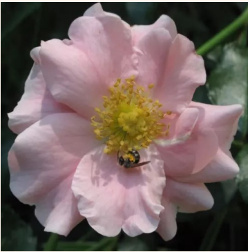
Rosa Satin Haze®

vaaleanpunainen - maanpeiteruus 40-60 cm keskivahvasti tuoksuva ruusu - aprikoosiarominen Mogens Nyegaard Olesen