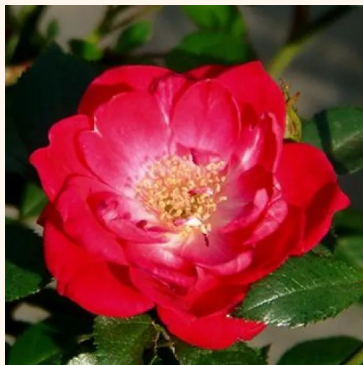
Rosa Fairy Rouge

valkoinen - maanpeiteruus 60-90 cm ei tuoksua - - Wilhelm Kordes III.