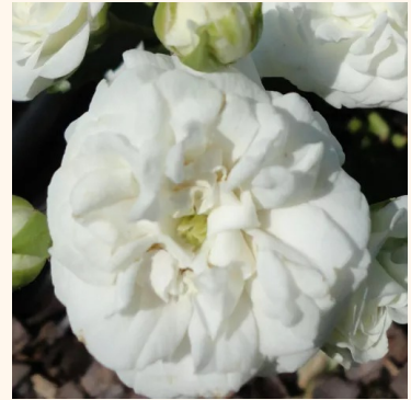
Rosa Icy Drift®

vaaleanpunainen - maanpeiteruus 60-80 cm hienovaraisen tuoksuinen ruusu - vanilja-arominen Discovered by - pharmaROSA®