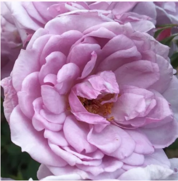
Rosa Dream Lover

punainen - kääpiö - mini ruusu 20-40 cm hienovaraisen tuoksuinen ruusu - neilikkausteinen arominen -