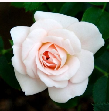
Rosa Lovely Symphonie