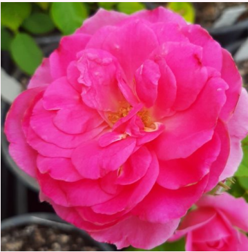
Rosa Bridget Hit®

vaaleanpunainen - kääpiö - mini ruusu 20-50 cm hienovaraisen tuoksuinen ruusu - greipin arominen Olesen, Pernille & Mogens N.