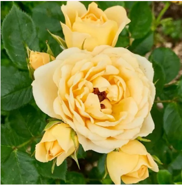
Rosa Sweet Memories

keltainen - kääpiö - mini ruusu 30-60 cm hienovaraisen tuoksuinen ruusu - syreeninomainen Whartons' Nurseries