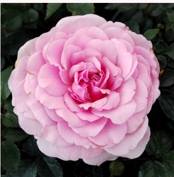
Rosa Juanita Hit®

vaaleanpunainen - kääpiö - mini ruusu 40-50 cm hienovaraisen tuoksuinen ruusu - makea arominen L. Pernille Olesen, Mogens Nyegaard Olesen