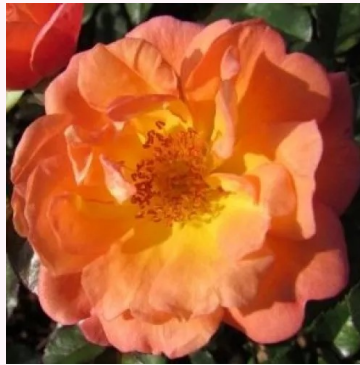
Rosa Thank You