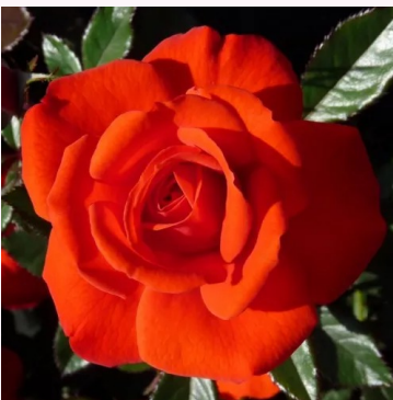
Rosa Top Hit®

punainen - kääpiö - mini ruusu 30-40 cm ei tuoksua - - Meiland International