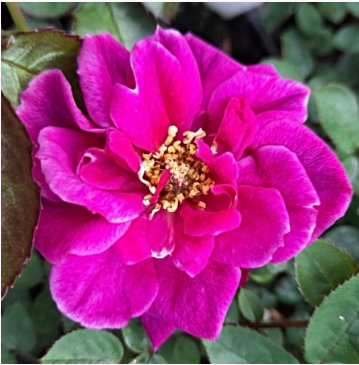
Rosa Blue Peter™

liila - kääpiö - mini ruusu 10-50 cm keskivahvasti tuoksuva ruusu - myskiarominen De Ruiter Innovations BV.