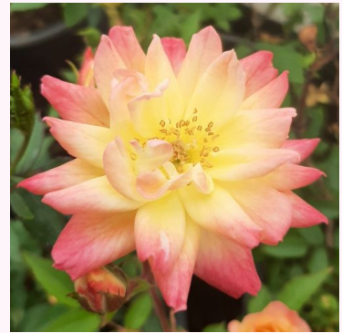
Rosa Baby Masquerade®

oranssi - kääpiö - mini ruusu 20-40 cm voimakkaan tuoksuinen ruusu - hapan arominen Ralph S. Moore