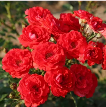
Rosa Zwergenfee 09®

punainen - kääpiö - mini ruusu 30-40 cm ei tuoksua - - W. Kordes & Sons