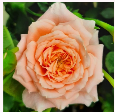
Rosa Sweet Dream®

vaaleanpunainen - kääpiö - mini ruusu 40-80 cm ei tuoksua - - Gordon Kirkham