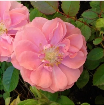
Rosa Randilla Rose

vaaleanpunainen - kääpiö - mini ruusu 30-40 cm ei tuoksua - -