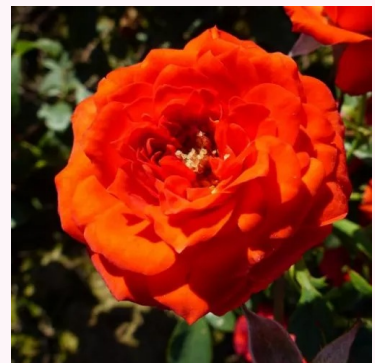
Rosa Orange Symphonie