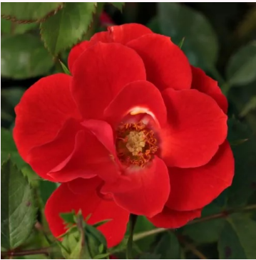
Rosa Tara Allison™

keltainen - kääpiö - mini ruusu 30-40 cm ei tuoksua - - Hans Jürgen Evers