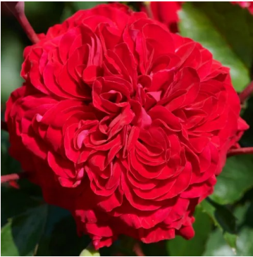
Rosa Alberte Hit®