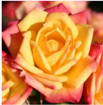
Rosa Little Sunset®

punainen - valkoinen - kääpiö - mini ruusu 30-35 cm hienovaraisen tuoksuinen ruusu - hapan arominen Samuel Darragh