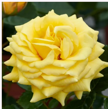
Rosa Juanna Hit®

vaaleanpunainen - kääpiö - mini ruusu 40-50 cm voimakkaan tuoksuinen ruusu - omenan arominen L. Pernille Olesen, Mogens Nyegaard Olesen