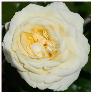
Rosa Fabiola Hit®

vaaleanpunainen - kääpiö - mini ruusu 50-60 cm ei tuoksua - - PhenoGeno Roses