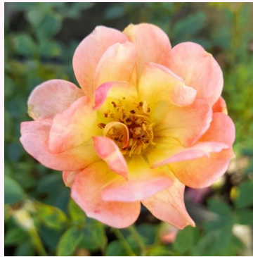
Rosa Fond Memories

keltainen - kääpiö - mini ruusu 40-50 cm hienovaraisen tuoksuinen ruusu - teearominen Gareth Fryer