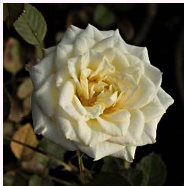
Rosa Moonlight Lady™

vaaleanpunainen - kääpiö - mini ruusu 40-60 cm hienovaraisen tuoksuinen ruusu - hapan arominen W. Kordes & Sons