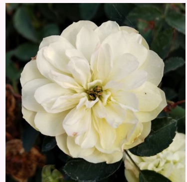
Rosa Green Ice

keltainen - kääpiö - mini ruusu 30-40 cm hienovaraisen tuoksuinen ruusu - myskinen arominen Mattock, John