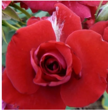
Rosa Randilla Rouge

vaaleanpunainen - kääpiö - mini ruusu 30-40 cm ei tuoksua - -