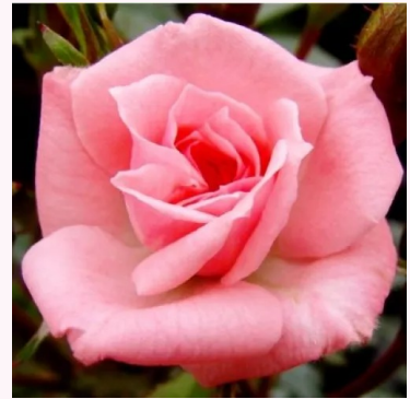
Rosa Rennie's Pink™

punainen - kääpiö - mini ruusu 30-40 cm ei tuoksua - -