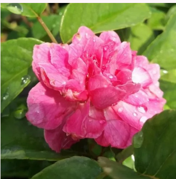
Rosa Bajor Gizi

keltainen - vaaleanpunainen - kääpiö - mini ruusu 20-40 cm ei tuoksua - - Mathias Tantau, Jr.