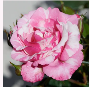
Rosa Inda Hit®

vaaleanpunainen - kääpiö - mini ruusu 20-30 cm ei tuoksua - - Györy Szilveszter