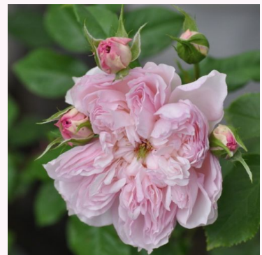
Rosa Randilla Jaune

vaaleanpunainen - kääpiö - mini ruusu 30-40 cm hienovaraisen tuoksuinen ruusu - myskinen arominen PhenoGeno Roses