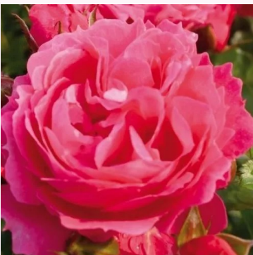
Rosa Moin Moin®