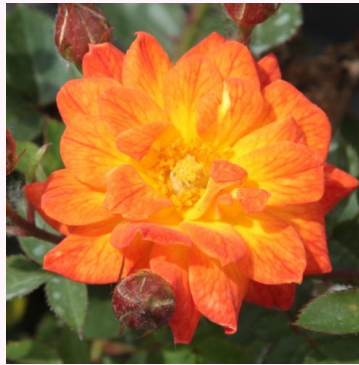
Rosa Baby Darling™

valkoinen - kääpiö - mini ruusu 18-22 cm ei tuoksua - - Győry Szilveszter