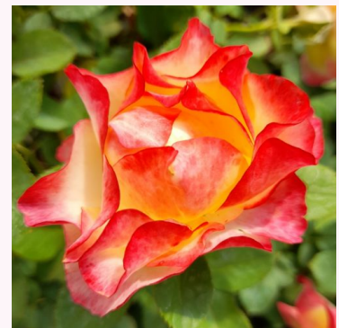
Rosa Katrina Hit®

keltainen - kääpiö - mini ruusu 40-50 cm keskivahvasti tuoksuva ruusu - sitruunan arominen L. Pernille Olesen, Mogens Nyegaard Olesen