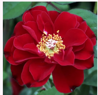
Rosa Fekete István

valkoinen - kääpiö - mini ruusu 40-50 cm hienovaraisen tuoksuinen ruusu - vadelmanarominen L. Pernille Olesen, Mogens Nyegaard Olesen