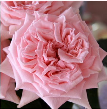
Rosa Indian Silk

vaaleanpunainen - kääpiö - mini ruusu 40-50 cm hienovaraisen tuoksuinen ruusu - kanelin arominen L. Pernille Olesen, Mogens Nyegaard Olesen