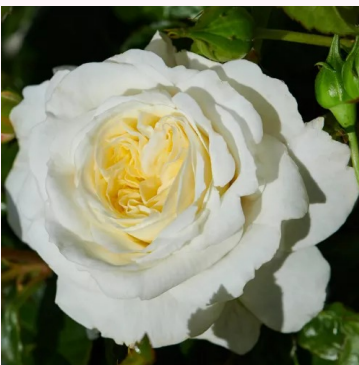
Rosa Georgia Hit®