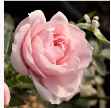
Rosa Blush Parade®

liila - kääpiö - mini ruusu 25-30 cm ei tuoksua - - Louis Lens