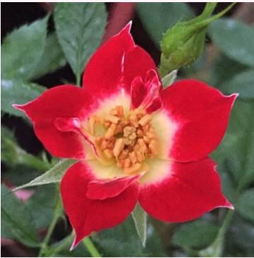
Rosa Little Artist

punainen - kääpiö - mini ruusu 50-60 cm ei tuoksua - - Márk Gergely