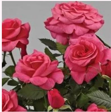
Rosa Emilia Hit®

vaaleanpunainen - liila - kääpiö - mini ruusu 60-70 cm hienovaraisen tuoksuinen ruusu - greipin arominen Colin A. Pearce