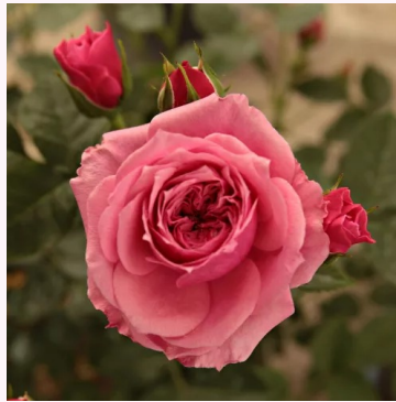
Rosa Pink Babyflor®

vaaleanpunainen - kääpiö - mini ruusu 30-50 cm voimakkaan tuoksuinen ruusu - mangoaromainen PhenoGeno Roses