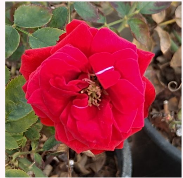
Rosa Tilt Symphonie

vaaleanpunainen - kääpiö - mini ruusu 40-50 cm hienovaraisen tuoksuinen ruusu - mangoaromainen Paul Chessum