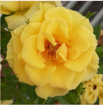
Rosa Flower Power Gold™

punainen - kääpiö - mini ruusu 40-50 cm hienovaraisen tuoksuinen ruusu - aprikoosiarominen L. Pernille Olesen, Mogens Nyegaard Olesen