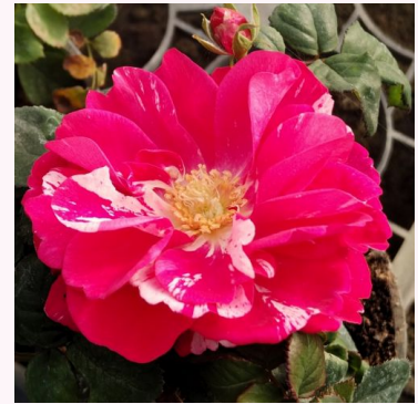
Rosa Jasmine Hit®

oranssi - kääpiö - mini ruusu 20-40 cm ei tuoksua - - Mogens Nyegaard Olesen