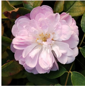
Rosa Dainty White

vaaleanpunainen - kääpiö - mini ruusu 30-60 cm hienovaraisen tuoksuinen ruusu - aprikoosiarominen W. Kordes & Sons