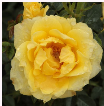
Rosa Gold Pin™

valkoinen - kääpiö - mini ruusu 40-50 cm hienovaraisen tuoksuinen ruusu - teearominen L. Pernille Olesen, Mogens Nyegaard Olesen