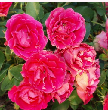
Rosa Spanish Caravan

valkoinen - kääpiö - mini ruusu 30-50 cm ei tuoksua - - W. Kordes & Sons