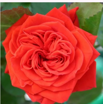
Rosa Chica Flower Circus®

punainen - kääpiö - mini ruusu 40-50 cm hienovaraisen tuoksuinen ruusu - mansikan arominen PhenoGeno Roses