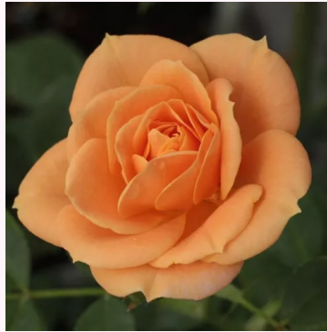
Rosa Apricot Clementine®

punainen - kääpiö - mini ruusu 40-50 cm hienovaraisen tuoksuinen ruusu - mansikan arominen L. Pernille Olesen, Mogens Nyegaard Olesen