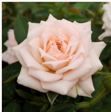
Rosa Special Friend

punainen - valkoinen - kääpiö - mini ruusu 30-50 cm ei tuoksua - - Łukasz Rojewski