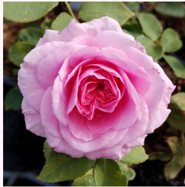
Rosa Carola Hit®

vaaleanpunainen - kääpiö - mini ruusu 40-50 cm hienovaraisen tuoksuinen ruusu - persikan arominen L. Pernille Olesen, Mogens Nyegaard Olesen