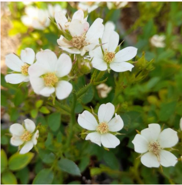
Rosa Babszem Jankó

vaaleanpunainen - kääpiö - mini ruusu 30-40 cm hienovaraisen tuoksuinen ruusu - centifolian arominen PhenoGeno Roses